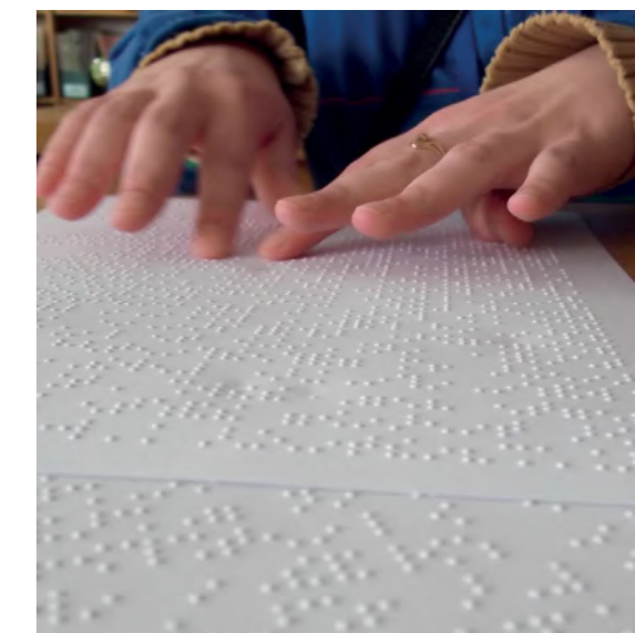
NUOTRAUKOJE: LIETUVOS AKLŪJŲ BIBLIOTEKA

Taigi tiek specializuota institucija, teikianti paslaugas akliems, pavyzdžiui, garsinių knygų biblioteka, tiek ir bendras paslaugas teikianti biblioteka, pavyzdžiui, akademinė arba viešoji biblioteka, kuri teikia tas pačias paslaugas visiems savo vartotojams nepriklausomai nuo to, ar jie turi negalią, gali būti įgaliotoji institucija.