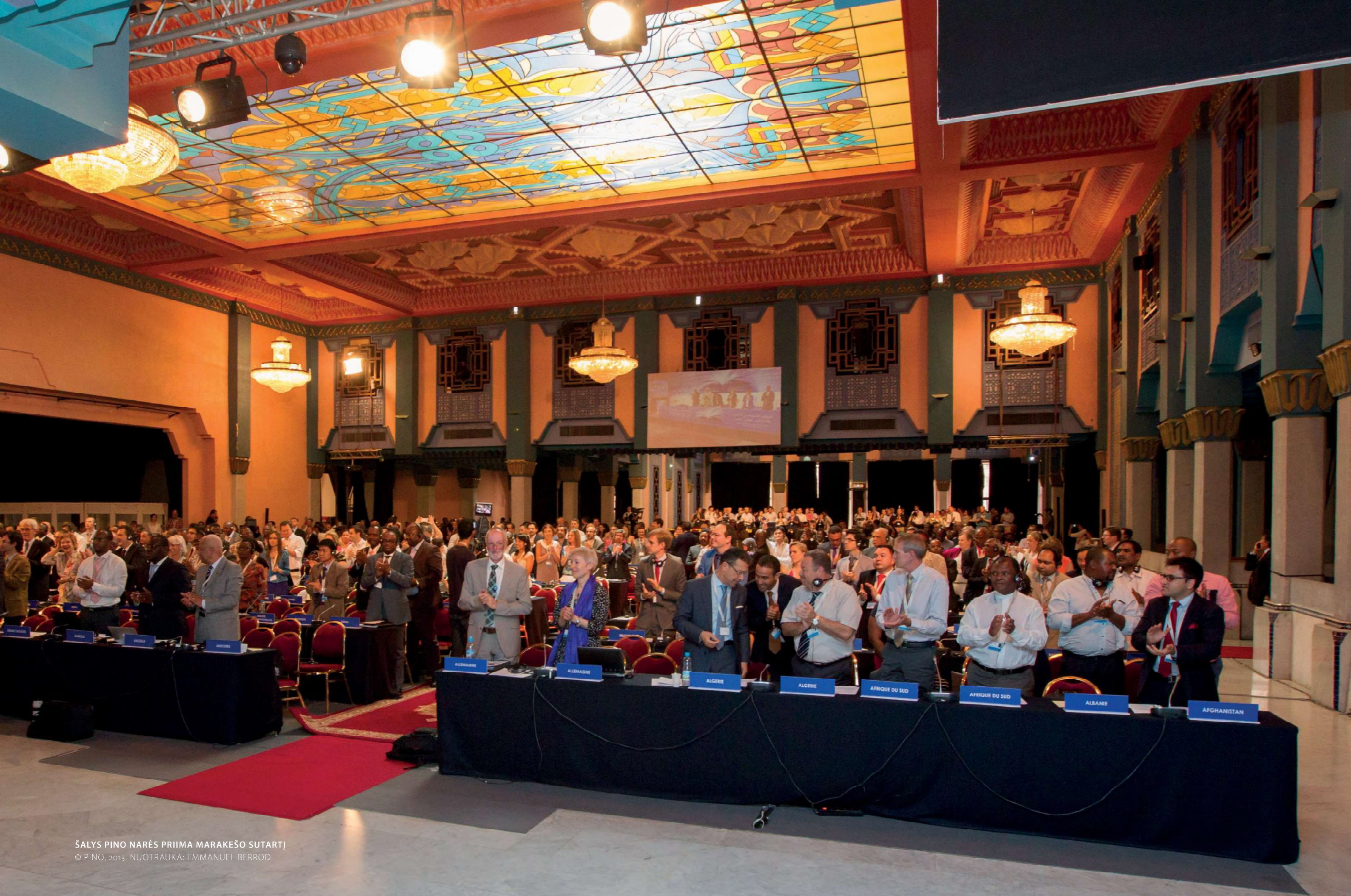
ŠALYS PINO NARĖS PRIIMA MARAKEŠO SUTARTĮ