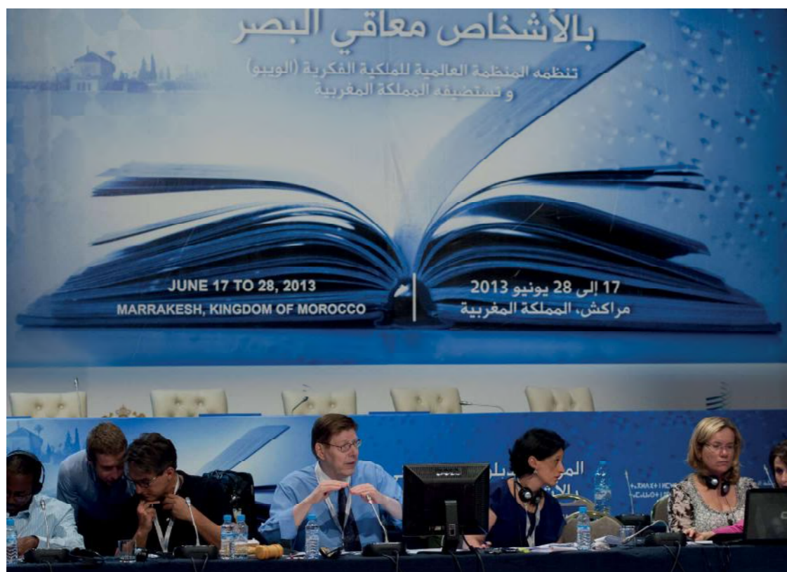
MARAKEŠO SUTARTIES DERYBOS.

bibliotekos gali visai atsisakyti teikti tokią paslaugą. 12 Žinoma, jei kopiją specialiuoju formatu galima įsigyti rinkoje, biblioteka visada gali nuspręsti nusipirkti tokią kopiją.